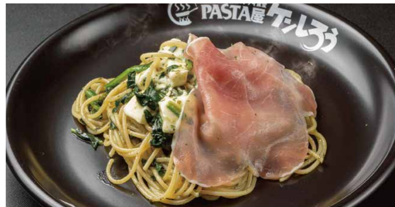
生ハムとほうれん草・モzzarellaのジェノバ 人気 1500円 (税抜1364円)