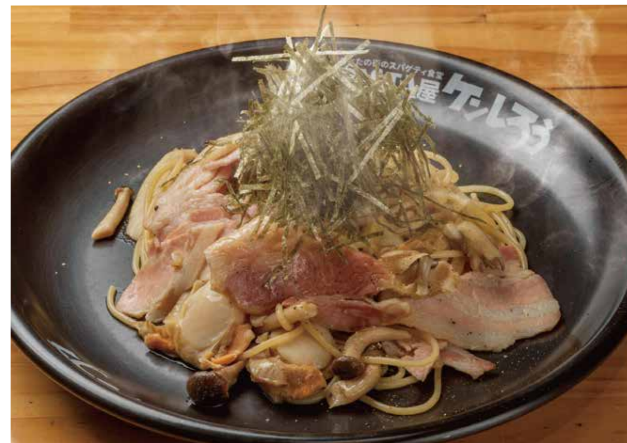
ホタテとキノコ・ベーコンのバター醤油 1500円 (税抜1364円)