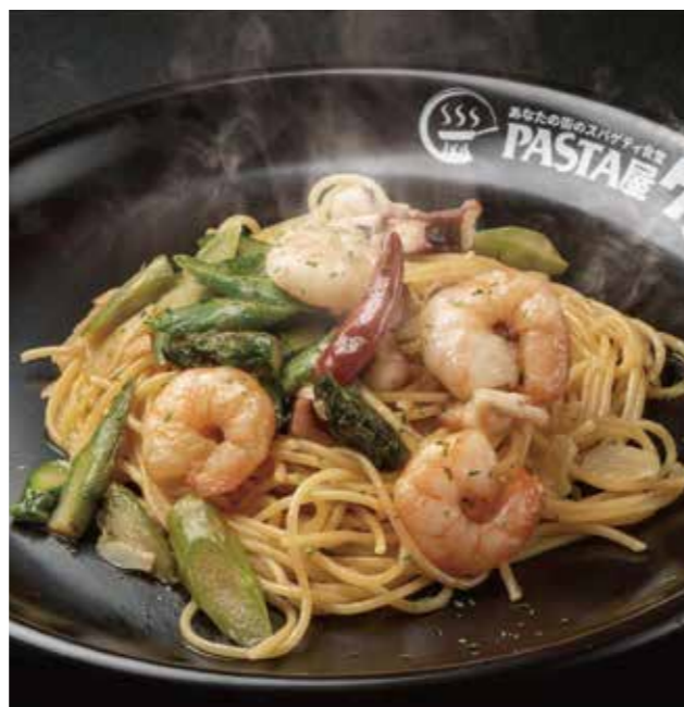
海老とアスパラ・タコのペペロンチーノ 1500円 (税抜1364円) 人気