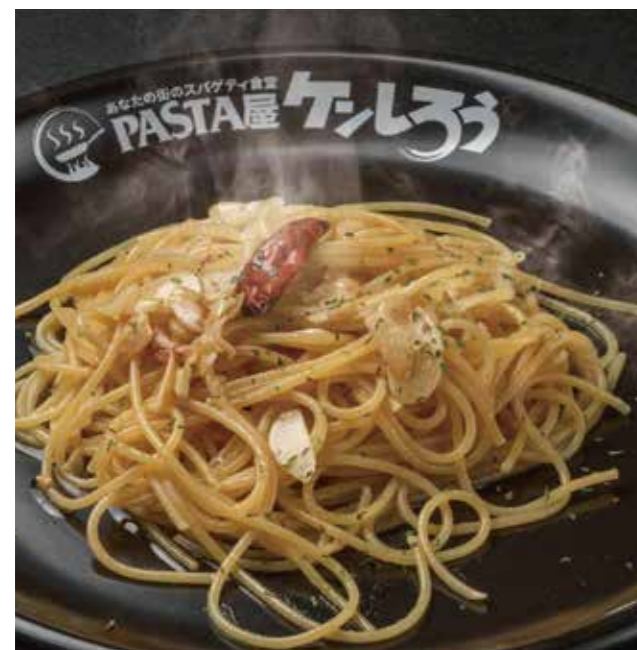
アーリオ・オーリオ・ペペロンチーノ 800円 (税抜728円) 職人技